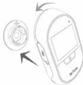
Inserte PHV MAC